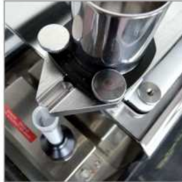
Micro doseur de classe 4A