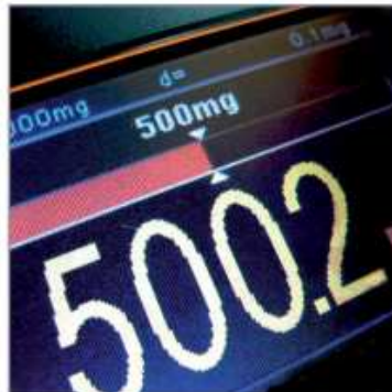
Précision, rapidité et endurance dans un même concept