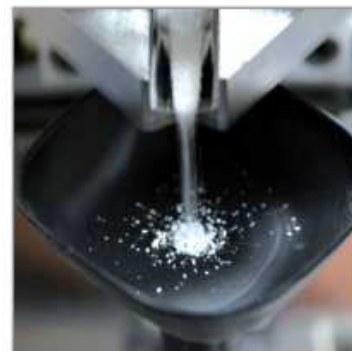
Micro-dosage efficace, simple et précis