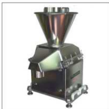
Une conception totalement dédiée à l'efficacité