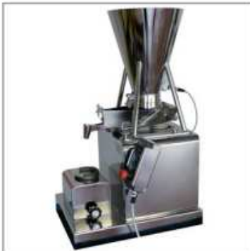
Micro-doseur pour le remplissage de pots