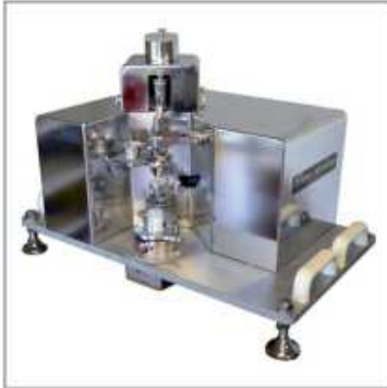
Système de micro-remplissage de barillets pour l'industrie pharmaceutique