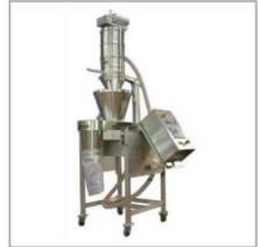
Remplissage pondéral de sacs de prémix