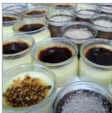
Utilisation pour la décoration de desserts