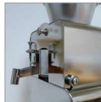
Fonctionnement en mode continu ou « batch »