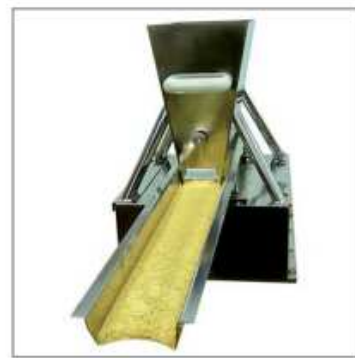
Stockage et transfert ouvert de poudre cosmétique