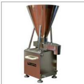
Doseurs à perte de poids de qualité hygiénique