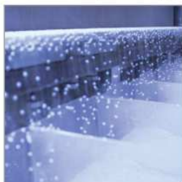
Saupoudrage contrôlé sur de grandes largeurs