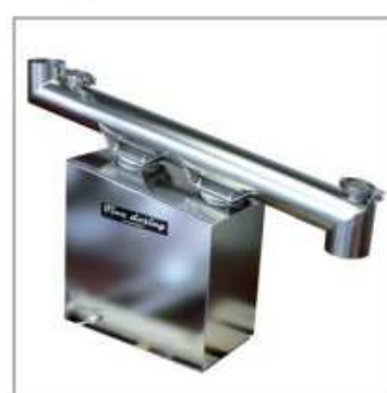
Liaison étanche entre 2 équipements de process.