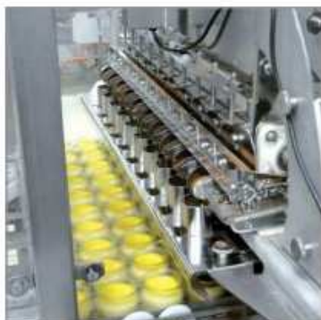
Saupoudreur / doseur multi-pistes sur ligne

La qualité de répartition, sans défauts ni aberrations, sur la surface à saupoudrer. Notre expérience du saupoudrage de produits très fins (sucre glace, amidon) ou de granulés (cubes ou copeaux de chocolats, raisins secs...) nous a conduit à développer des solutions spécifiques pour répondre aux multiples contraintes de chaque application.