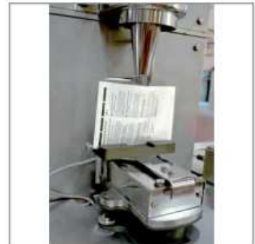
Remplissage de sachets (application médicale)