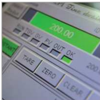
Des solutions performantes et ergonomiques