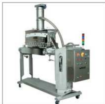
Saupoudreur monté sur un châssis mobile en « C » pour faciliter les opérations de nettoyage